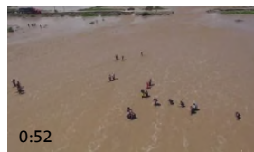
Pluies diluviennes et inondations au Pérou: 75 morts 21.03.2017