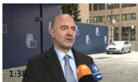
Côté UE, "tout est prêt" pour l'activation du Brexit 21.03.2017