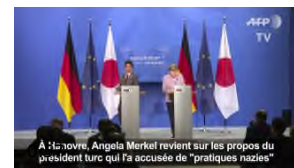
Merkel menace d'interdire les responsables turcs de meetings 20.03.2017