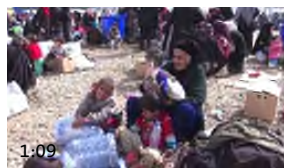
Mossoul-Ouest: plus de 180.000 personnes poussées à la rue 21.03.2017